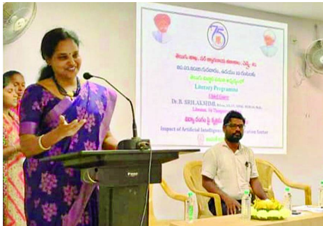
తెలుగు శాఖ, సర్ త్యాగరాయ కళాశాల